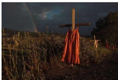
Amber Bracken , Canadese fotograaf, kindergraven bij de Kamloops Indian Residential School.

150.00 inheemse kinderen die tussen 1870 en 1970 op katholieke scholen tot 'assimilatie' gedwongen werden door mentale, fysieke en seksuele mishandeling en doodslagen. Paus Franciscus heeft er zijn excuses voor aangeboden.