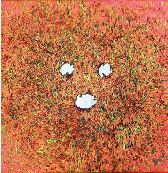
Hyon Gyon Voice of Violence , gebrande satijn op doek, 70x70, 2012

Genoeg ellende om ons schilderij van de Zuid-Koreaanse kunstenaar Hyon Gyon weer eens goed in te laten dringen.