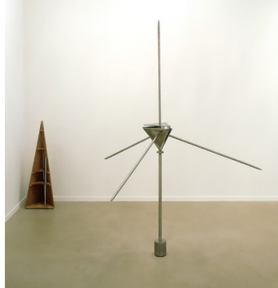
G. van Bakel: UTAH-MACHINE , 81x81x68,7, 1980 Het wagentje van het goede en het kwade , van geluk en ongeluk - van bi-polair denken , 165 x 42 x 33 cm, 1984, Bonnefantenmuseum en dan kan een derde manier van denken niet ontwikkeld worden. Tetraëder , 108 x 37,5 x 30 cm geopend: 199 x 169,5 x 144 cm, 1982, Van Abbemuseum

"Het grote wiel van de Utah-machine van Gerrit van Bakel bevat een oliereservoir dat bij temperatuurstijging uitzet en bij temperatuurdaling inkrimpt. De maximumsnelheid is 18 millimeter per dag. Gerrit van Bakel reageert op de acceleratie van de tijd." (Pr.Do.127)