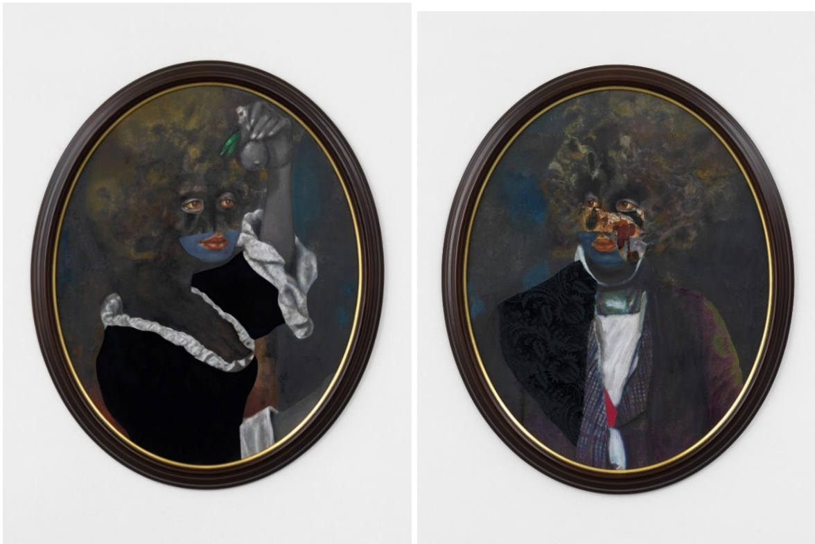
Detach in the Garden mixed media 85x67 2019 Detach,

Ik zag zijn werken bij Thierry Goldberg in New York en was direct onder de indruk. Ik kocht het werk 'Detach', zonder iets van de achtergrond te weten, puur en alleen omdat het collageschilderij me enorm intrigeerde. Het hangt hier al een dik jaar in huis voordat ik onlangs op zoek ging naar de achtergrond.