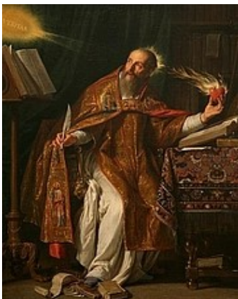
Aurelius Augustinus (354-430) Brandend Hart 1645 (78.74x62.23) van Philippe de Champaigne (Brussel 1602-1674) LACMA-Los Angeles County Museum dat wij bezochten in 2011

Het leven is niet altijd gemakkelijk, we moeten volhouden, doorzetten, onszelf enthousiasmeren, er is geen andere weg - nu we toch eenmaal hier zijn.