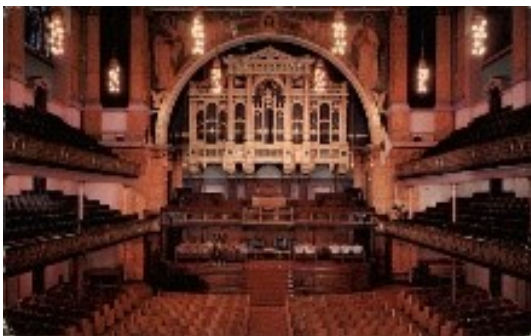
Boston 'Tremont Temple Baptist Church'