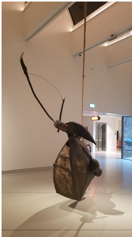
met kussen verzachte kruk 1971, 48x35, 1970