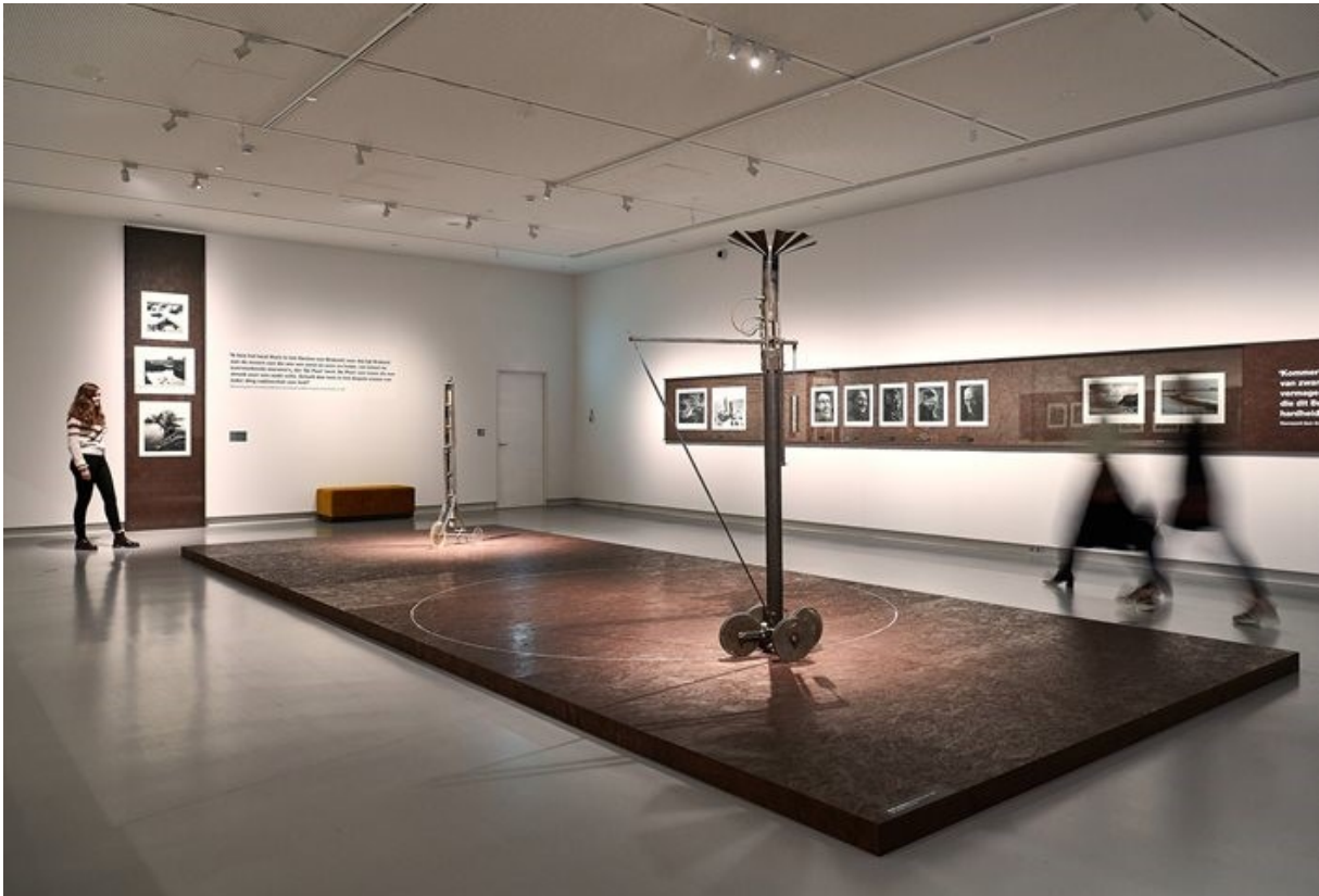
Martien Coppens foto's en Gerrit van Bakel met zijn Automobieltje en Winterwagentje dat de cirkel van het leven volgt

'De Poëzie van de Peel' in het Noordbrabants Museum is nog te zien tot en met 21 februari 2021. (Zie Privé Domeinen: 125, 127, 140)