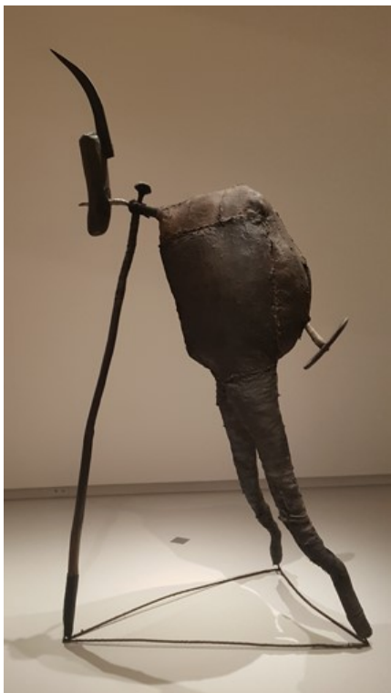
object met zeisvorm 1982/1983