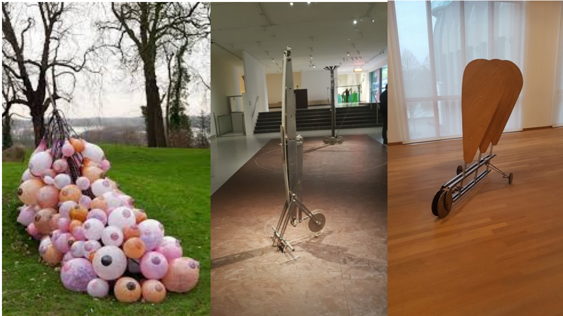
Automobieltje en Winterwagentje - de rijpe borsten van 'Maria' Roosen - Wagentje dat het Goede en Kwade vervoert (Bonnefantenmuseum - tot 3 januari 2021)