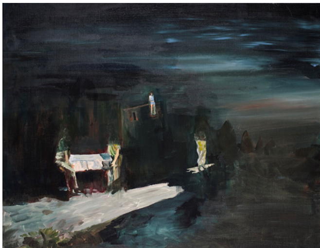
Unt., acryl on canvas, 70x90, 2011