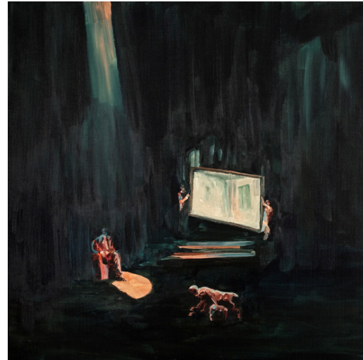
Unt., acryl on canvas, 100x110, 2011