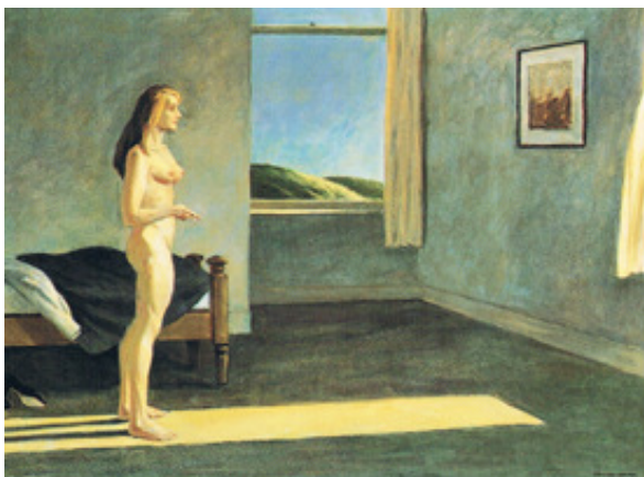
E. Hopper, A Woman in the Sun, oil on canvas, 101,6x 152,4,1961

De huizen zijn eerder Duits dan Nederlands. Onverwachte lichtbundels snijden sterk door huizen en personen. Perspectivische verschillen versterken het beeld en de paarsige gloed die in veel van zijn schilderijen voorkomt creëren een psychomagische sfeer. Er gebeurt niet veel maar de paarsige gloed roept niet te duiden verwachtingen op die meer op onheil dan op geluk duiden, een voorbode van de storm die gaat komen.