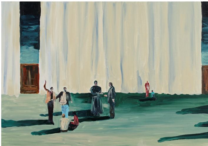
Unt., acryl on canvas, 70x100, 2011

Er wordt een interactie veronderstelt die eigenlijk niet echt plaatsvindt en beantwoord wordt.