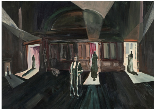
Untitled, acryl op doek, 100x140, 2011

Bij Aaron weten we dat die dwergen verworpen mensen zijn. De ruimte bij Aaron is meer werkelijk in het nu, het zou een bestaande ruimte kunnen zijn waar zich duistere tafereelens afspelen. De ruimte van Matijs is geënceneerd, ontleend misschien aan een foto van een ruimte uit een vervlogen tijd, het zou een ruimte uit een van de Venetiaanse gebouwen kunnen zijn, met meerdere vervreemde perspectieven in één tafereel. Juist dat maakt spannend, juist het verkeerde geeft dimensie aan het tafereel. Mensen in toga's? lopen in en uit. Scherpe afgesneden, verstijfde lichtinvallen benadrukken in een donkere omgeving. Wat doet die gehurkte man daar? Hun overeenkomsten zijn dat hun beider surreëel is, figuratief en toch ook abstract omdat je er bij beiden geen greep op krijgt en veel aan de kijker wordt overgelaten.