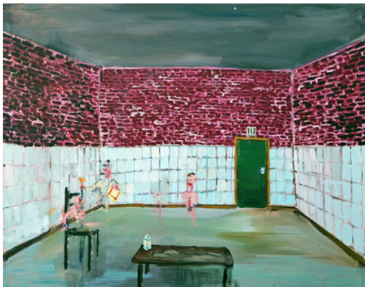
De dwerg die gedwangvoederd wordt, olieverf op doek, 90x180, 2005