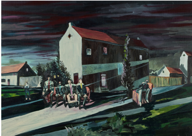
Unt., acryl on canvas, 100x140, 2011