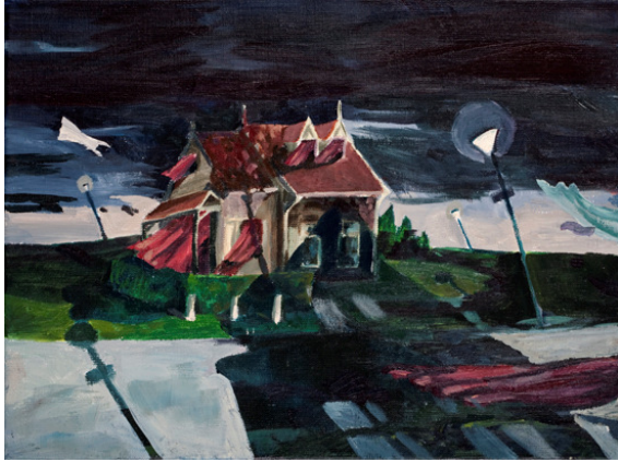
Unt., acryl on canvas, 24x30, 2011