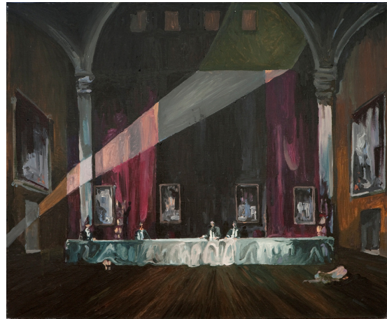
Unt., acryl on canvas, 100x120, 2009