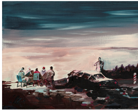
Unt., acryl on canvas, 24x30, 2011