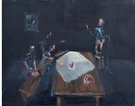
In a Hall with mead and mead, 120x150, 2011