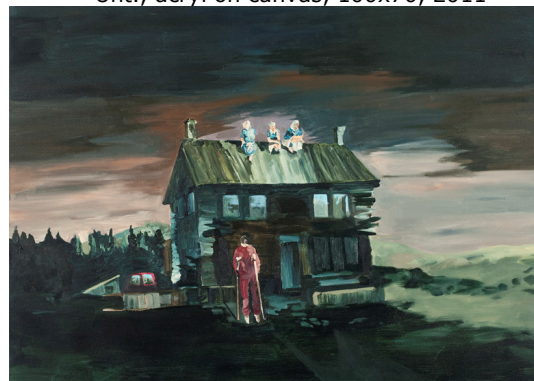
Unt., acryl on canvas, 100x140, 2011

Het laatste woord is nog niet gezegd over deze schilder.