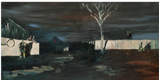
Unt., acryl on canvas, 40x80, 2011