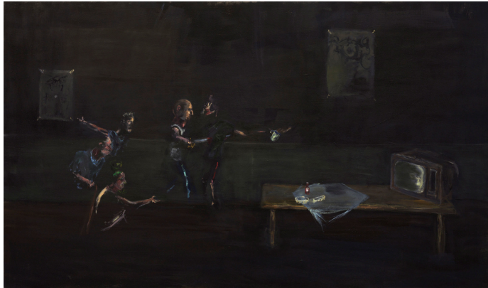
Unt., oil on canvas, 150x250, 2011