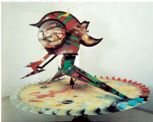
Rammellzee, Mettropostersizer, Epilogue Futurism The Weather Vanier 720 Z, 300x400, 1985-1986