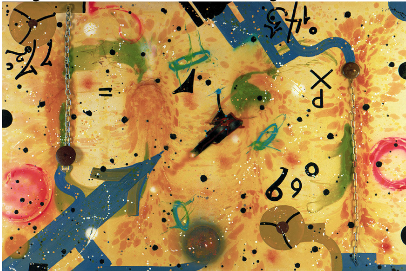
Rammellzee, The Bands of Steel with the naked eye, mixed media, 200x300, 1985

Hadden de graffitikunstenaars niet het recht hun toekomst in eigen handen te nemen, de 'bands of steel' te ont-ketenen, hadden zij niet het recht hun naam te schrijven, " Here I'AM.....". Wanneer ontstond eerder in de kunstgeschiedenis van zo onderop een totaal kunst met muziek, dans en beeldende kunst ineen.....veelal zonder academische meestergraad. Natuurlijk was dat onverdraagbaar voor de heren op het pluche. De Ali's, Kadaffi's denderen naar beneden en beneden wordt BOVEN. En zie de jeugd laat zich niet meer bedotten, miljoenen werden aangestoken door het fenomeen graffiti.