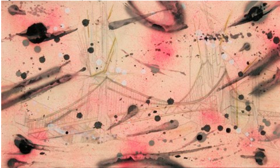
Rammellzee, Bridge Connector between egos and superegos, spray paint/marker on board, 45x75, 1985