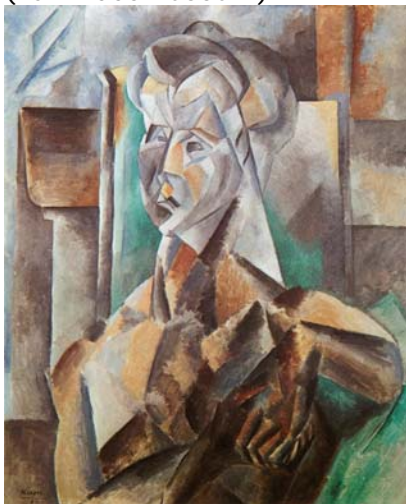
Picasso, 'Vrouw in 't Groen 1909

In mijn boek staat een verhaal van een kind over de "Groene Vrouw" van Picasso. (van Abbemuseum)