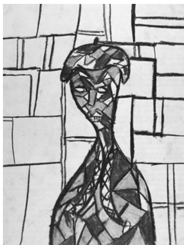
Kleurenbordkrijt, klas 3 1969/1970

"Van Koning tot gevangene. Dit schilderij is van Picasso. Volgens mij moet dit een koning voorstellen Die gevangen genomen is. Hij staat nu voor de rechter. Zijn gezicht staat heel droevig. Wat zal hem nu overkomen? De rechter stelt vragen. Wilt u uw land overgeven? Ja. Durft u nog wat over ons te zeggen? Nee. Wilt u gevangen genomen worden? Nee. Dan zult u voor ons moeten werken. Welk is dan uw mening? Dan toch maar liever gevangen zijn. Vooruit mannen breng hem weg. Hij wordt nu naar de cel gebracht. Toen het avond werd dacht hij waar blijft dat eten toch? Maar er kwam niets. Al drie dagen zat hij gevangen zonder eten of drinken. De volgende dag kwam de gevangenebewaarder. Deze vond de koning dood uit het raam hangen. Met hem was het gedaan. "