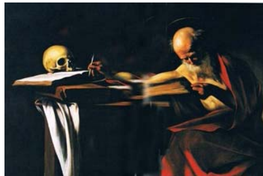
St. Hiëronymus (1606)