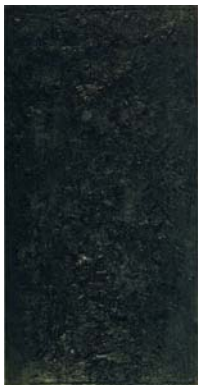
Armando Espace Criminel 1958 door HP aangekocht voor gemeente coll. Helmond 1979 p.5

We hadden hun voorbeeld gevolgd, elke schoenwinkel verkocht plotseling ijzerbeslag. We vonden het stoer. Zeg maar eerlijk. (p.84)