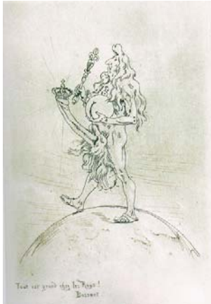
Lodewijk XIV (4)