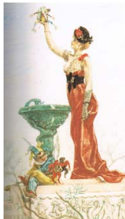
De dame met de hansworst (La Dame au pantin) (4)