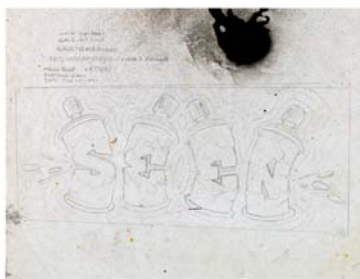
Artikal canvas - white high light, pencil with inkblot on paper: Z1.5427.3. 180283