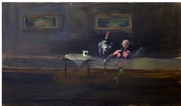
Zonder titel, 80x160, 2009

Caravaggio begaat een moord en is voortdurend op de vlucht voor zijn donkere levenswandel, beleeft de liefde zowel met jonge mannen als vrouwen, te land en te water, schuimbekt het water tot grote hoogte, kan de zon niet langer verdragen: " ....mijn zicht werd beperkt door een nevel, kan de kleuren niet zien zoals ze zijn –" de zwarte zon heeft me volledig in zijn macht...". (p. 113) In zijn duister universum schijnt de zon niet. Of wellicht beter: is de zon zwart.... (p. 128). In zijn werken zijn de achtergronden vaak egaal donker zwart.